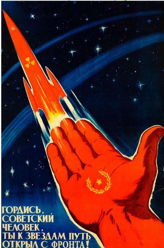
Affiche 1 : « Soyez fiers, Soviétiques ! Vous avez ouvert la voie depuis la Terre vers les étoiles ! »