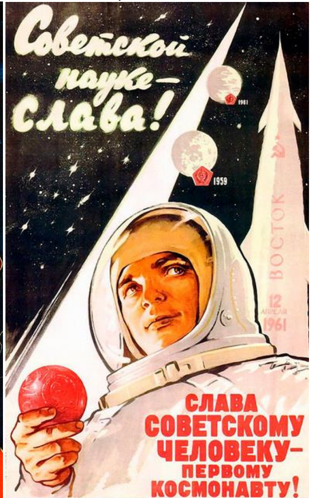
Affiche 2 : « Gloire à la science soviétique ! Gloire à l'homme soviétique – le premier cosmonaute ! »