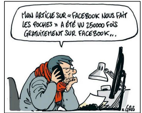
Doc. G- Caricature 2