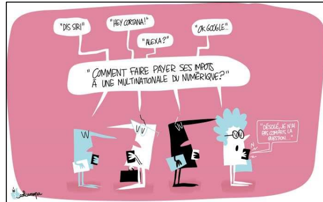
Doc. A- Les géants du numérique